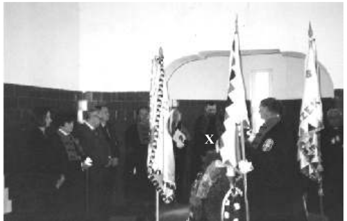
X – coordonatorul volumului