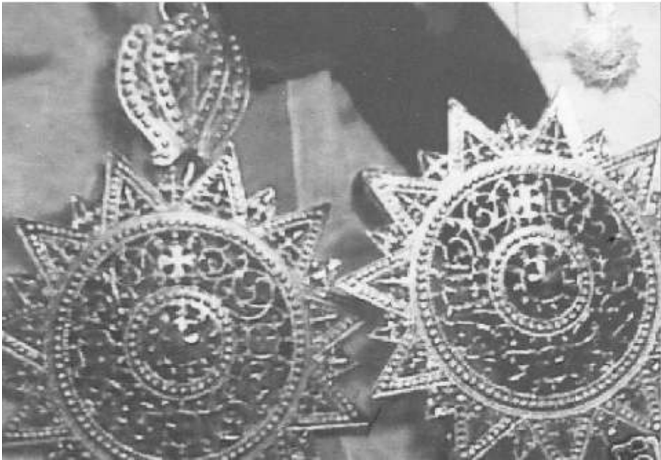
Ordinul Menellik al II-lea, Grad de Mare Cruce