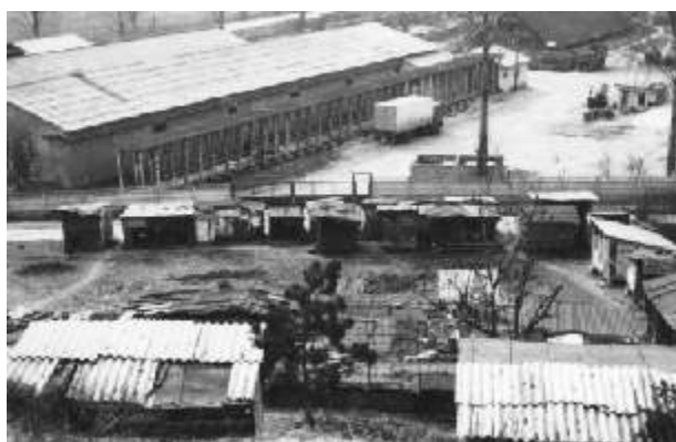
Aiud, Cimitirul deținuților politici, 1992