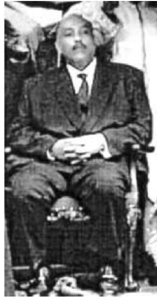
MS Imperială, Negus Negesti, Zera Yakob al II-lea al Ethiopiei, în Exil