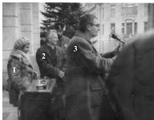
Miting în favoarea Proclamației de la Timișoara, Cluj 1990: 1. Doina Cornea 2. Constantin Ticu Dumitrescu 3. Andrei Iustin Hossu