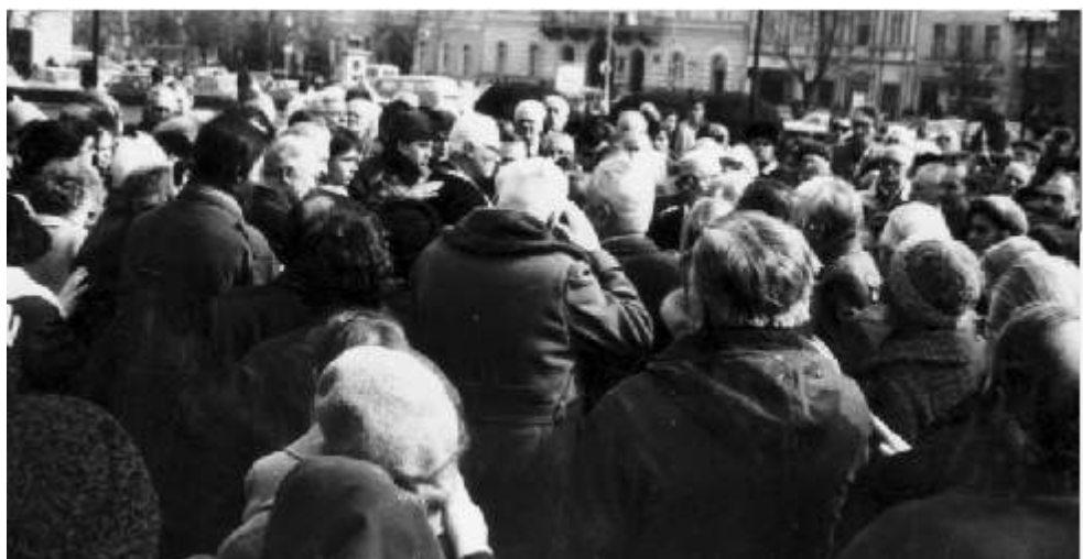
Slujbă de pomenire a deținuților politici, Cluj, 9.03.1992