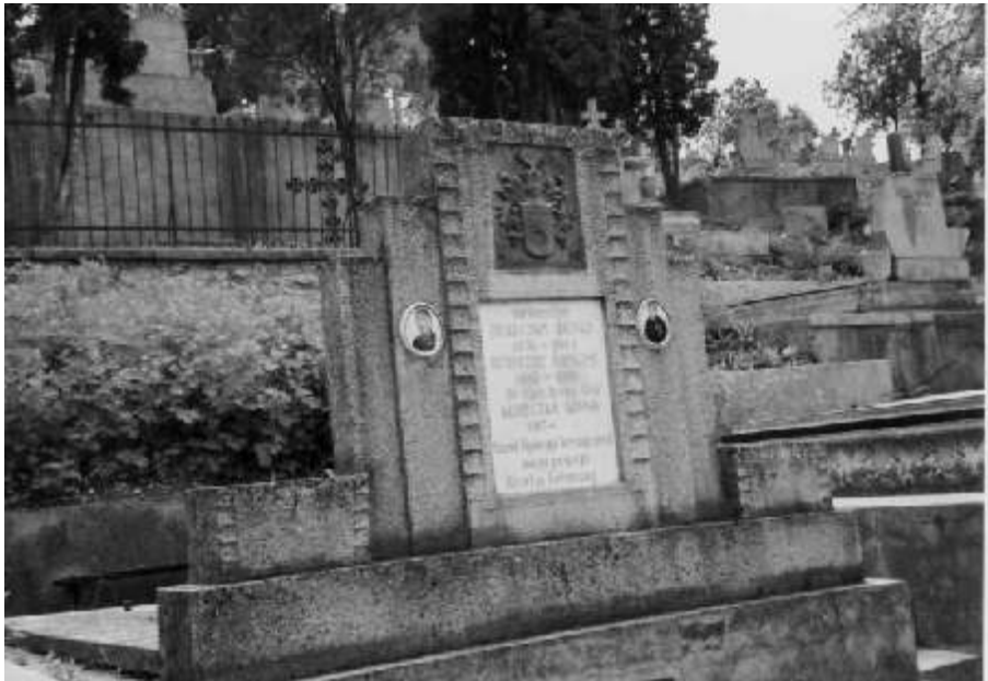
Mormântul fam. Bereczky din Cimitirul Central din Turda