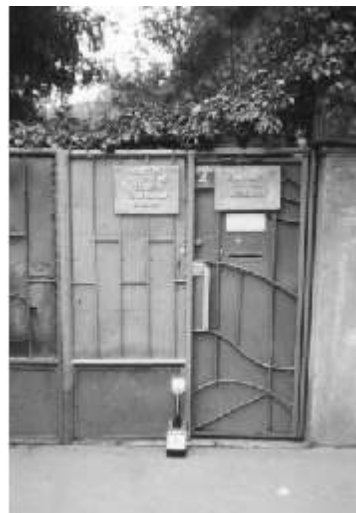
Poarta de intrare în curtea locuinței fam. Berezky de pe str. George Coșbuc