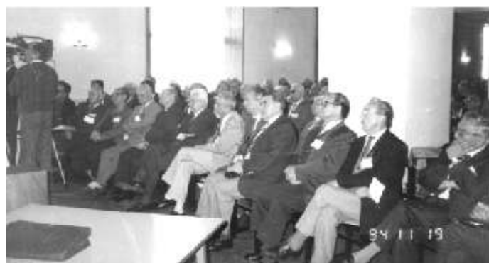
Congres al Deţinuţilor Politici Maghiari, 19.11.1994