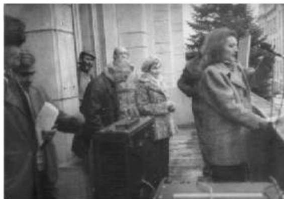
Același miting