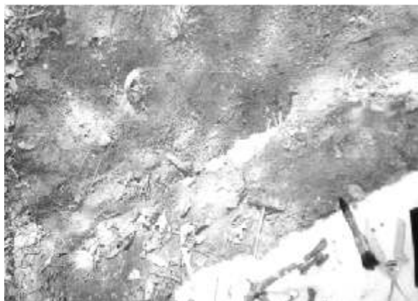
Crimele comunismului ies la iveală (Fizeșul Gherlei)