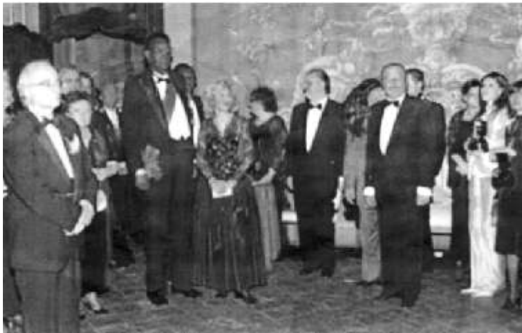
MS Regele Kigeli al V-lea al Ruandei la o recepție