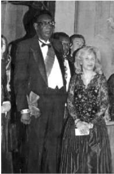
MS Regele Kigeli al V-lea al Ruandei, în Exil