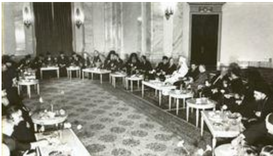
Ceausescu si reprezentantii cultelor 1968