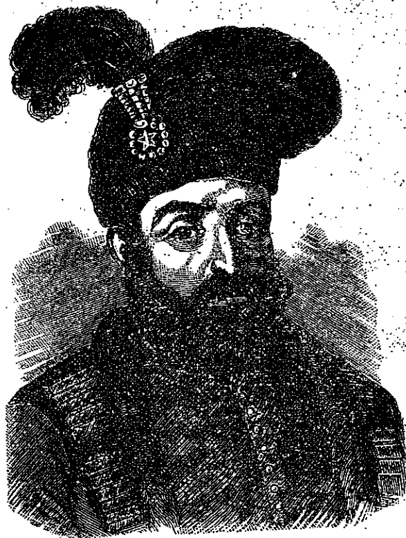
STIHURI ÎN STEMA DOMNIEI MOLDOVEI

De și vezi când-va semn gróznic, Sa nu te miri când să arată puternic, Că puternicul puterea l' inchipuște. Si slăvitul podoaba l' schizmește. Cap de buâr si la domni moldovinești Ca puterea aceri hiéri să o socotesti; De unde mari Domni spre laudă s' au făcut cale De-acolo și Vasile Vod au început lucrurile sale, Cu învățături ce în țara sa temeriazeste, Nemuritor nume pe lume și zideste.